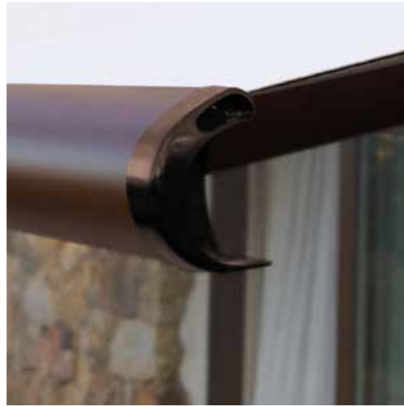
Terminale con gronda integrata Front bar with water-drain integrated Barre de charge avec gouttière intégrée Ausfallprofil mit integrierter Regenrinne