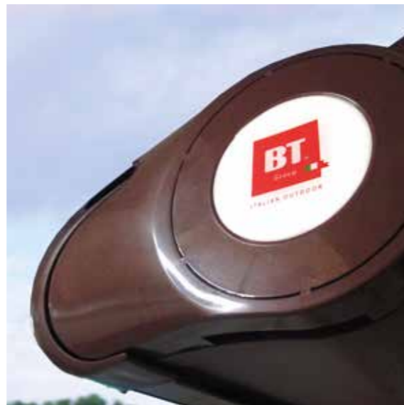
Chiusura perfetta Perfect closure Fermeture parfaite Perfekte Schließung