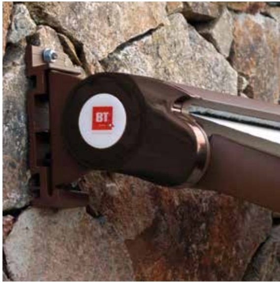
Attacco a parete Wall application Application paroi Wandmontage

STANDARD EQUIPMENT / ÉQUIPEMENT STANDARD / SERIENAUSSTATTUNG