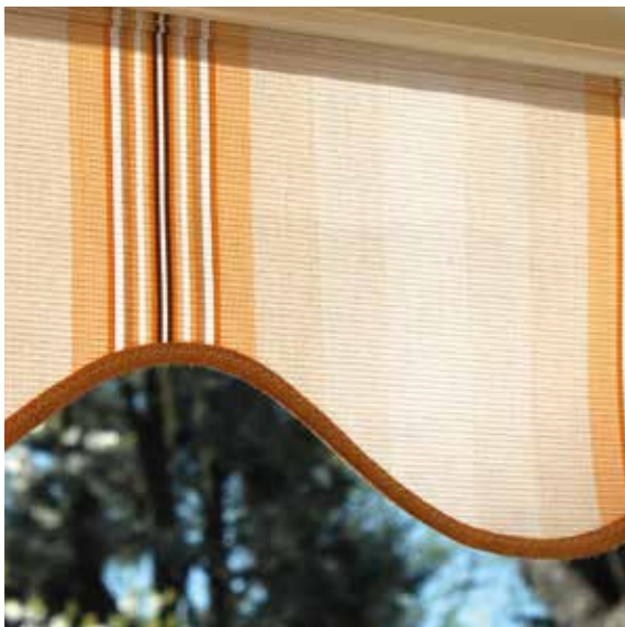
Mantovana H. 25 cm. Palmet H. 25 cm Volant H. 25 cm Volant H. 25 cm